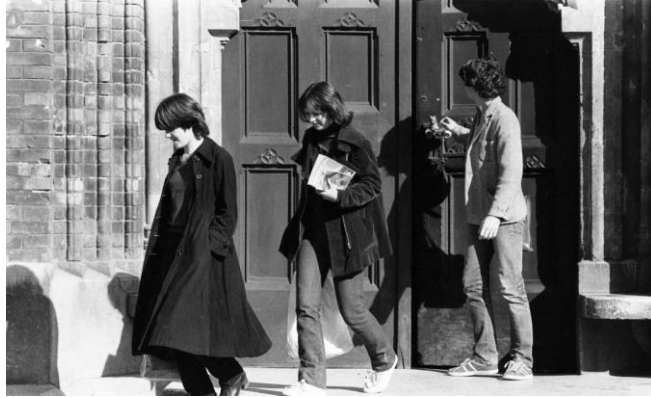
Életképek, Toldy Ferenc Gimnázium, 1970, 1974