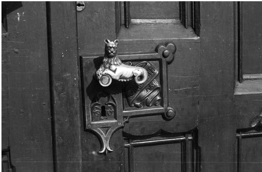
Németh György fotóesszéje, 2019. márczius

A Toldys Diáknapok (TDN) utolsó napján, 2019. március 22-én, pénteken, a Kortárs Építészeti Központ (KÉK) második toldys programját szerveztük meg. A vízivárosi sétát Klaniczay János építész , egykori tanítványunk, vezette. Túravezetőnk a városnéző séta mottóját Szerb Antaltól (1901-1945) kölcsönözte, mely az író Budapest kalauz: Marslakók számára című, 1935-ben megjelent könyvének élén olvasható: