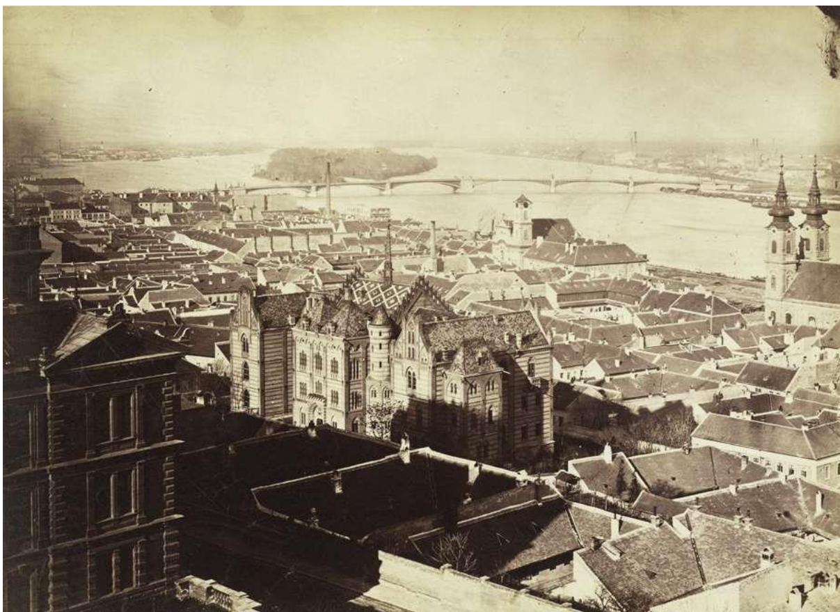
Kilátás a Halászbástyáról a Vízivárosra a Margit-sziget felé nézve, 1876.