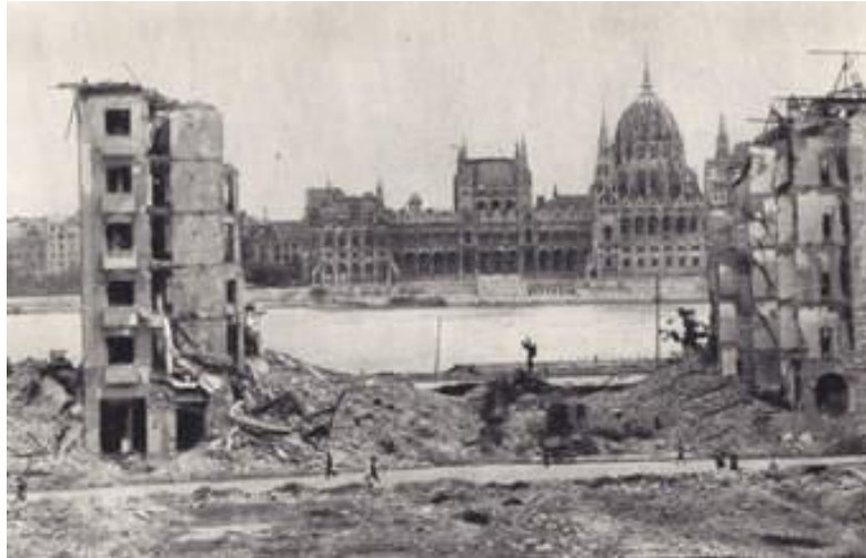
A budai Duna parton álló polgári házat 1945. január 2-án bombatalálat érte; Vitéz utca 2 - Fő utca 61.