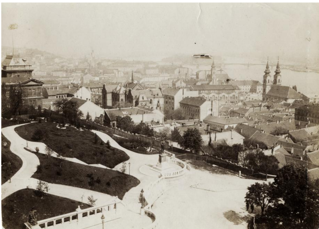
Kilátás a Vízi Város felé. Elő térben a Hunyadi szobor és a Hunyadi János úti hajtókanyar. Balra a Királyi Egyetemi Katolikus Gimnázium, előtte a Toldy Gimnázium; jobbra a Batthyány téren a Szent Anna-templom; 1906